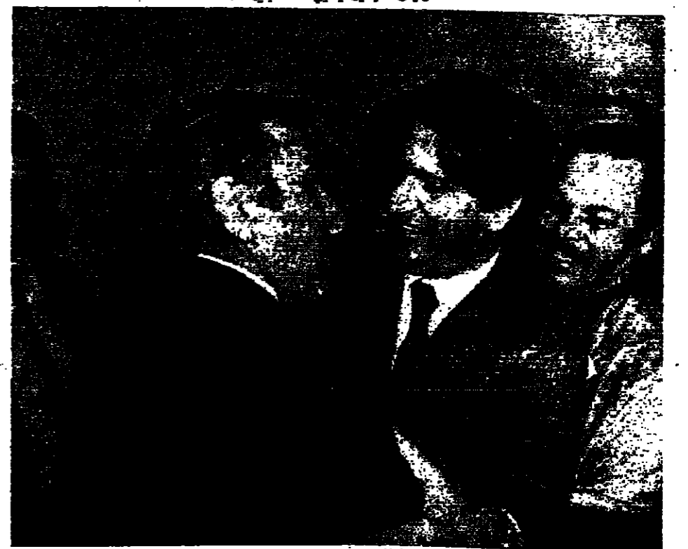
رئيس بلدية صيدا يرحب